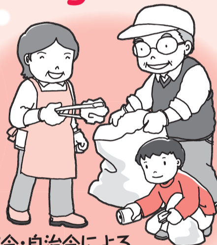
町会・自治会による地域福祉交流事業