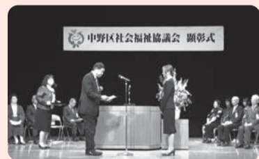
昨年度顕彰式の模様