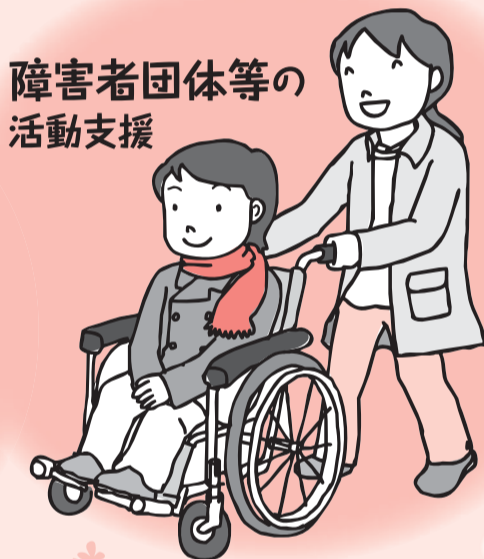
障害者団体等の活動支援