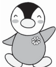
東京都民生委員・児童委員キャラクター「ミンジ」

今年3年に一度の改選期で、厚生労働大臣から委嘱された309人の民生児童委員が、12月1日より新期体制で活動を開始します。 民生児童委員は、子育てから高齢者の相談、消防署や警察署への協力等、生活全般にわたり身近な相談相手として、住民と行政や関係機関との橋渡し役として活動しています。守秘義務もあります。「民生児童委員の仕事は大変ね」と言われますが、