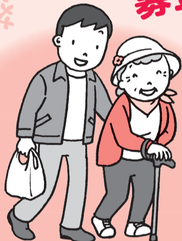
ボランティア・NPO団体による地域福祉事業