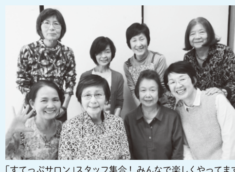
「すてつぷサロン」スタッフ集合！ みんなで楽しくやっています

*居場所情報交換会としては実施せず 北部圏域支えあいフォーラム(区主催)に社協として参加・協力。 2月14日(水) 野方区民活動センター