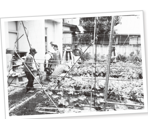
サロン「さぎろくはたけ365」 大事に育てた野菜とともに畑で交流

東日本大震災より 7年が経過しました 「もう7年ですね。震災のこと、思い出すのもつらいんです」 「ここに(中野に)住んで、外にできれば近所さんが声をかけてくれる。ひとり暮らしだけど、ひとりじゃないみたい。地域の方に優しくしてもらい本当に感謝しています」 「家ではひとりなのでサロンに行けば、みんなと話をするのが楽しみ!」 東日本大震災から7年、中野区内に避難されている方々の声です。中野社協では引き続き、地域の方々の協力を得ながら区内に避難されている方への支援を行っています。戸別訪問での相談、交流サロンの開催、情報紙の発行など、これからも避難されている方が中野で安心して生活できるよう取り組んでいきます。