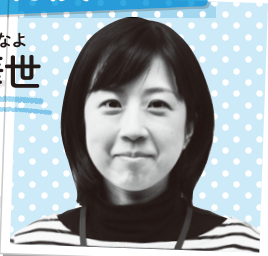
りゅうぞの はなよ 龍菌 華世