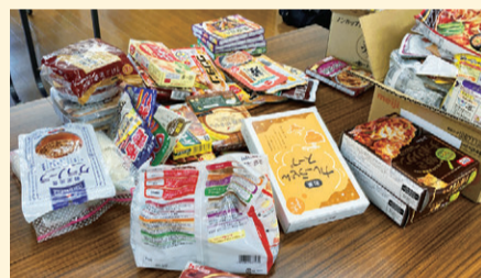
7月17日、鷺宮地域にて第1回フードパントリーを実施しました

みなさんからの募金を財源に、中野区内のボランティア・地域活動に取り組み団体や、社会福祉法人・企業、行政などが協働して、生活に困っている人に食を通じて支援をするプロジェクト「中野つなぐるフードパントリープロジェクト2021」も着々と実施中です。