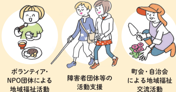
ボランティア・NPO団体による地域福祉活動

昨年度は募金総額 19,065,219円 が区内の地域活動等に使われました。その一部をご紹介します。