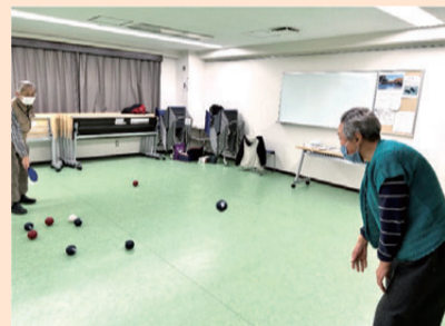
気分を変えて、体も動かして