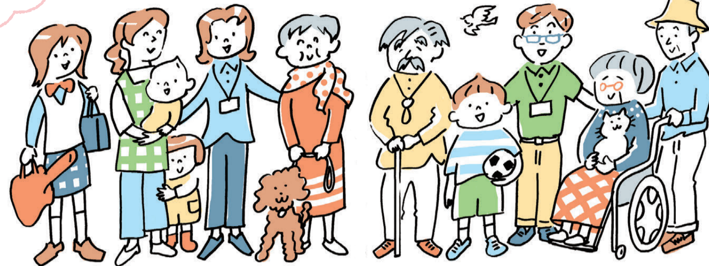
※詳しくは中野社協のホームページをご覧ください。

社協の事業の協力会員に登録し活動に参加したり、社協会員加入や寄付など経済的に社協を支えるなど、あなたの力が地域の課題解決のための大きな力となります。これからも社協といっしょに地域福祉を進めていきましょう。