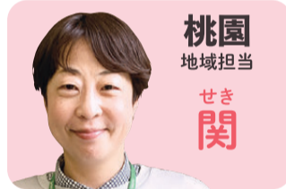
桃園 地域担当 せき 関