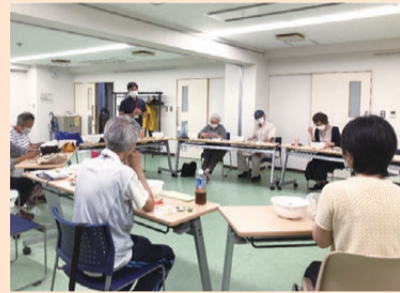
机を大きな輪に並べ、みんなで切手整理を。記念切手をきっかけに話に花が咲くことも