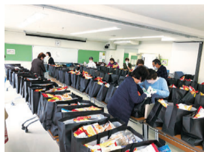
みんなで分担し、協力し合いパントリーバッグを作りました

たくさんの食料、とても助かります。物価高で家計が厳しい中、子育て中の我が家にとってはとてもありがたかったです。 仕事が減り給料も厳しい中、みなさまの温かいお気持ちに家族全員感謝しております。ご支援ありがとうございました。