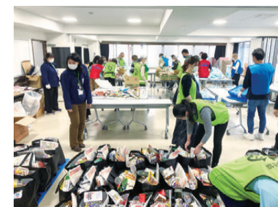
地域で活動するみなさまをはじめ、大変多くの方にご協力いただきました

この活動をきっかけに、さまざまな団体同士がつながり、継続して取り組む地域も出てきています。困ったときにみんなで支えあう地域づくりにつながっています。