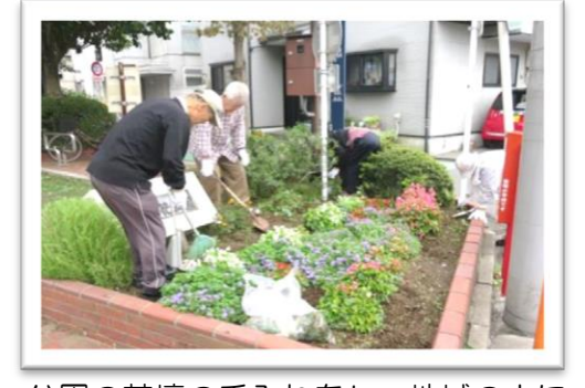
公園の花壇の手入れをし、地域の人に喜ばれています。