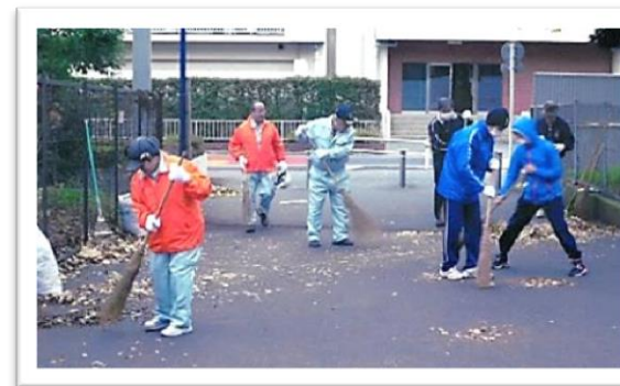
わたしたちのまちをきれいにします。

毎年 12 月 1 日～12 月 31 日に実施される募金です。町会・自治会やボランティア団体などの地域活動のために使われます。