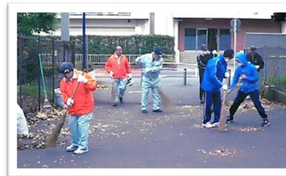
わたしたちのまちをきれいにします。

毎年12月1日～12月31日に実施される募金です。町会・自治会やボランティア団体などの地域活動のために使われます。