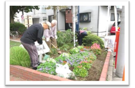
公園の花壇の手入れをし、地域の人に喜ばれています。